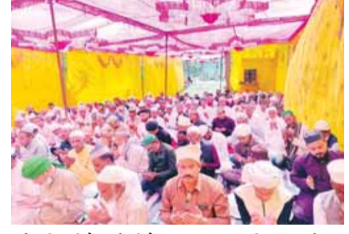
सभी अधिकारियों-कर्मचारियों का आभार व्यक्त किया। यह ईद का उत्सव अजयगढ़ में सद्भाव, एकता और आपसी प्रेम का खूबसूरत संदेश लेकर आया, जो पूरे क्षेत्र के लिए प्रेरणादायक रहा।