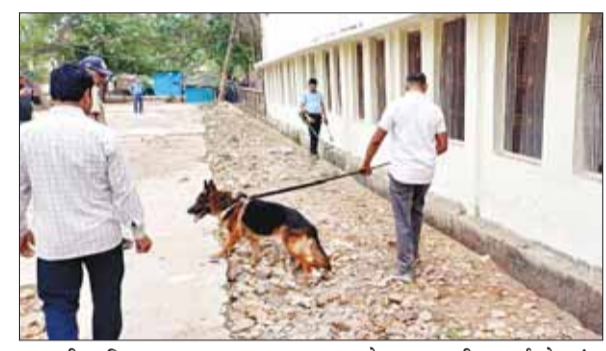
तलाशी अभियान चलाया गया।

उल्लेखनीय है कि शुक्रवार तड़के 5:34 बजे अदालत के आधिकारिक ईमेल पते पर एक संदेश प्राप्त हुआ। अज्ञात असांजिक तत्वों द्वारा भेजे गए इस मेल में दावा किया गया था कि अदालत परिसर और जजों के चेंबर में 15 जहरीले बम लगाए गए हैं, जो दोपहर 1 बजे ब्लास्ट होंगे। सूचना मिलते ही सतना और मैहर पुलिस सक्रिय हो गई और गोपनीय तरीके से सघन